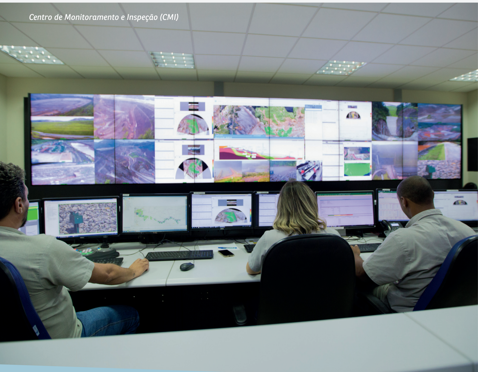
Centro de Monitoramento e Inspeção (CMI)